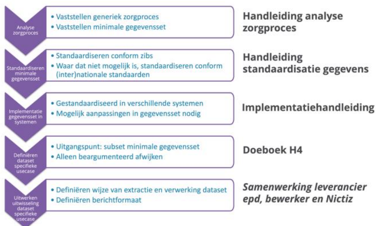
Afbeelding 1: Stappen Registratie aan de bron en bijbehorende handvatten.

Tegelijkertijd staan het Radboudumc en AvL open om andere ziekenhuizen die aan de slag willen gaan met het inbouwen van het gestandaardiseerde zorgpad voor de Hoofd Hals te helpen. In bijlage 1 vindt u een overzicht van de concrete projectresultaten en voorbeelden van de datasets. Daarnaast kunnen ziekenhuizen gebruik maken van de gepubliceerde handvatten van Registratie aan de bron.